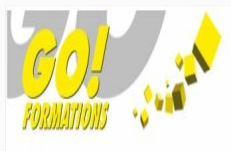
GO FORMATIONS SOCIÉTÉ